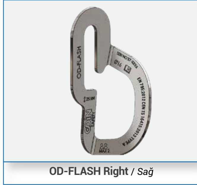
OD-FLASH Right / Sağ